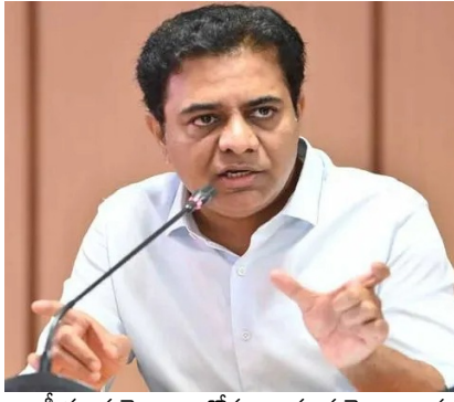
రాజకీయ ప్రయోజనాలకోసం రాష్ట్ర ప్రయోజనాలను తాకట్టు పెట్టడం ఎంతమాత్రం మంచిది కాదని కేటీఆర్ ప్రభుత్వానికి సూచించారు. ప్రభుత్వ పాలసీలు పెట్టుబడులను ఆకర్షించేందుకు అనుగుణంగా కొనసాగించాలన్నారు. అమరరాజా సంస్థ తెలంగాణలో రూ.9,500 కోట్ల పెట్టుబడులు పెట్టేలా వాళ్లను ఒప్పించేందుకు ఎంతో కట్టుబాటును గుర్తుచేశారు. రాష్ట్రానికి పెట్టుబ

జనపదం, హైదరాబాద్ : కాంగ్రెస్ సర్కార్ ఏర్పడిన తర్వాత ప్రభుత్వం వైఖరేంటో అర్థంకాక చాలా సంస్థలు రాష్ట్రాన్ని వీడుతున్నాయని, తెలంగాణ ప్రభుత్వం మాకిచ్చిన హామీలకు కట్టుబడి ఉండకపోతే రాష్ట్రం నుంచి వెళ్లిపోతామని అమర రాజా సంస్థ చెబుతున్నట్లుగా వార్తలు చూస్తున్నామని, అదే నిజమైతే చాలా దురదృష్టకరమని బీఆర్ఎస్ పార్టీకి ప్రెసిడెంట్ కేటీఆర్ అన్నారు. ఆదివారం ఆయన సానికంగా మాట్లాడారు. కాంగ్రెస్ ప్రభుత్వం వైఖరితో చాలా సంస్థలు ఇబ్బందులు పడుతున్నాయని, వారి వైఖరేంటో అర్థంకాక చాలా సంస్థలు రాష్ట్రాన్ని వీడుతున్నాయని వాపోయారు. కేన్సర్ టెక్నాలజీ అనే సంస్థ తెలంగాణ నుంచి గుజరాత్ కు వెళ్లిపోయిందని, కార్షింగ్ సంస్థ తమ ప్లాంట్ ను చెన్నైకి తరలించారని, ఇప్పుడు అమర రాజా కూడా వెళ్లిపోతామని చెబుతున్నారని, తెలంగాణ ప్రాండ్ కు ఇది తీవ్ర నష్టం చేస్తుందని ఈ సందర్భంగా కేటీఆర్ హెచ్చరించారు.