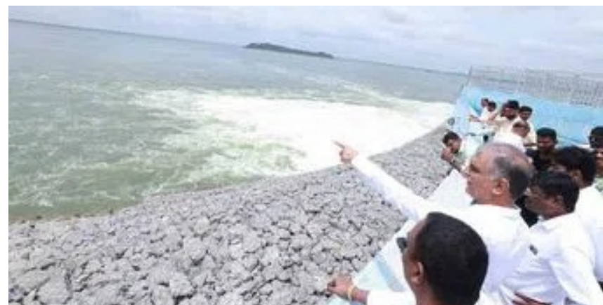
శ్వర జలాశయానికి తరలిస్తున్నారు. శనివారం సాయంత్రం పరక ఎల్లంపల్లి నుంచి 13 టీఎంసీలకుపైగా జలాలు మధ్య మోటర్ కు తరలివెళ్లు ప్రాజెక్టు అధికారులు తెలిపారు. మధ్యమోటర్ జలాశయంలో 27.54 టీఎంసీల నీటి సామర్థ్యాన్నికాను ప్రస్తుతం 17.06 టీఎంసీల నిలువ ఉన్నట్లు అధికారులు తెలిపారు. మధ్య మోటర్ నుంచి సిరిసిల్ల జిల్లా ఇల్లంపల్లి నుంచి అనంతగిరిలోని అన్నపూర్ణ ప్రాజెక్టుకు నీటిని తరలిస్తున్నారు. మధ్యమోటర్ నుంచి అందరేట నున్న ద్వారా తిప్పూర్లోని సర్వోపాల్ జలాలు చేరుతుండగా, ఇక్కడ పంపొనోస్ లో రెండు బాహుబలి మోటర్ ద్వారా 6,440 క్యూసెక్కుల అన్నపూర్ణ జలాశయానికి చేరుకుంటున్నాయి. ఇక్కడ జలాశయం గేట్లు తెరిచి అంతే మొత్తంలో రంగనాయక్ సాగర్ కు చేరుతున్నాయి.

జనపదం, సిద్దిపేట ప్రతినిధి : కాళేశ్వరం ప్రాజెక్టులో భాగమైన రంగనాయక్ సాగర్ జలాశయం గోదావరి జలాలతో నిండుకుంటున్న దృశ్యం చూసి తన మనసు పులకరించింది మాజీ మంత్రి హరీశ్ రావు తెలిపారు. సిద్దిపేట జిల్లాలోని రంగనాయక్ సాగర్ ప్రాజెక్టుకు గోదావరి జలాలు పరవళ్లు తోక్కుతుండడంతో ఎత్తిపోతలను ఎమ్మెల్యే హరీశ్ రావు పరీక్షించారు. ఈ సందర్భంగా ఆయన మాట్లాడుతూ రైతులకు నీరందించాలనే నిత్య తపనకు ఈ ప్రాజెక్టు నిదర్శనమన్నారు. అన్నదాతల ఆనందం, వారి ముఖాల్లో చిరునవ్వులక్షంగా బీఆర్ఎస్ ప్రభుత్వం పని చేసిందన్నారు. ఈ జలదృశ్యాన్ని చూస్తుంటే మనసు పులకరించిపోతోందన్నారు. కాళేశ్వరం ప్రాజెక్టు లింక్-2లో ఎత్తిపోతలు కొనసాగుతున్నాయి. పెద్దపల్లి జిల్లాలోని శ్రీపాద ఎల్లం పల్లి జలాశయం నుంచి అందరేట నున్న ద్వారా నంది మేడారంలోని పంపొనోస్ కు నీరు చేరుతుండగా, శనివారం మోటర్ ద్వారా 3,150 క్యూసెక్కుల నీటిని నంది రిజర్వాయర్లోకి ఎత్తిపోస్తున్నారు. అక్కడి నుంచి బి జంట సాగంగాల ద్వారా కరీంనగర్ జిల్లా లక్ష్మీపూర్లోని గాయత్రి పంపొనోస్ కు తరలిపోతున్నాయి. ఇక్కడ కూడా ఒకే మోటర్ నడిపిస్తున్నారు. మొత్తం 3,150 క్యూసెక్కుల నీటిని ఎత్తిపోస్తూ శ్రీ రాజరాజే