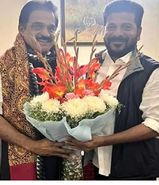
సమాచారం. చంద్రబాబు ఉత్తమ్ దంపతుల భేటీ. రేపంతో పై ఫిర్యాదులు

(మొదటిపేజీ తరువాయి) సమయంలో ఇక్కడ మంత్రి ఉత్తమ్ కుమార్ రెడ్డి భార్యతో కలిసి ఆంధ్రప్రదేశ్ సీఎం చంద్రబాబును కలిశారు. రేపంతో తీసుకుంటున్న ఒంటెత్తు పోకడలతో రాష్ట్రంలో పరిస్థితులు గందరగోళంగా మారుతున్నాయని, పెద్ద తలలుగా పరిగణించే వారు ఇబ్బందులు పడుతున్నారని వివరించారు. మరీ ముఖ్యంగా హైదరాబాద్ రాజకీయ, సీసీ, ఇతర రంగాల ప్రముఖుల పునాదులు కదులుతున్నాయని, ఆ విషయంలో సీఎం ఎవరు చెప్పినా వినే దాఖలాలు కనిపించడం లేక తప్పనిసరిగా బాబుతో చెప్పికోల్పిస్తున్న సమాచారం. చాపకింద నీరులా సీఎం వర్సెస్ సీనియర్స్..